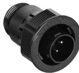
Bild A (dargestellt: DELK1110-P04) figure A (shown: DELK1110-P04)