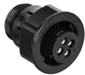
Bild B (dargestellt: DELK1110-S04) figure B (shown: DELK1110-S04)